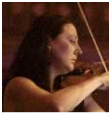
Vanía Batchvarova Violon