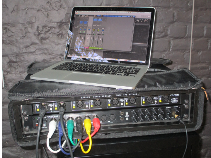
Fig. 2 : The bandoneon in-ear setup.

It can be opted for an in-ear monitoring for the first bandoneon as its condenser microphones were often the cause of feedback when using standard monitoring loudspeakers. The concept is also based on giving the bandoneon player as much as possible control over the local in-ear mix.